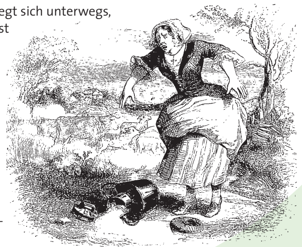
Illustration von Grandville

Milch zum Markt und überlegt sich unterwegs, vom Erlös der Milch zunächst ein Huhn zu kaufen. Aus dem Verkauf der Eier würde sie sich ein Schwein und davon letztlich gar eine Kuh kaufen können. Während dieser Träumereien stolpert das Mädchen und verschüttet die Milch – ihre Pläne sind dahin, bevor sie sie umsetzen kann. Ihre Milchmädchenrechnung geht leider nicht auf.