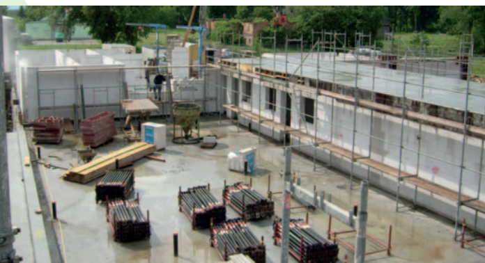
Die künftige Milchabfüllung