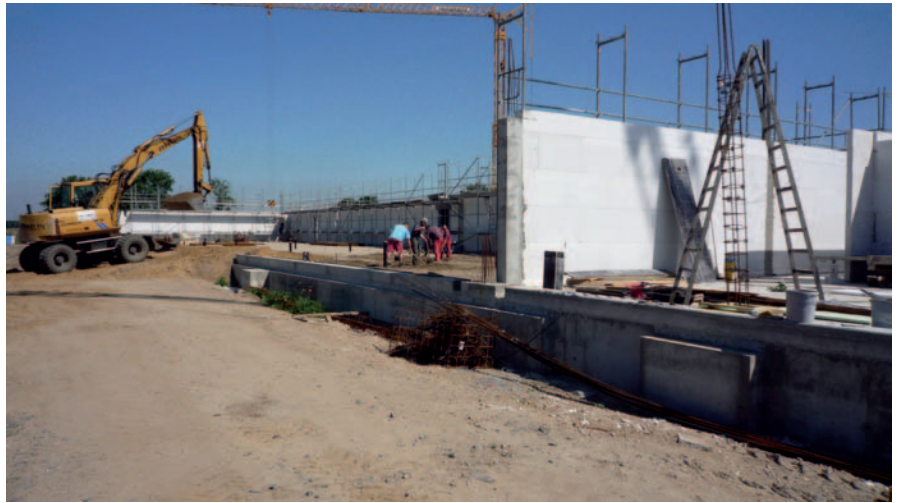
Blick in die künftige Käsefertigung

In den nächsten Wochen werden die Dachträger (Binder) und die Pfetten eingebaut, so dass das Dach geschlossen und abgedichtet werden kann. Im Anschluss können die Paneelwände für die Produktionsräume eingebaut und im August der spezielle Industriefußboden verlegt werden. Im September beginnen dann der Einbau der Produktionstechnik sowie erste Arbeiten im Bereich Haustechnik. Beauftragt wurden bisher vor allem Firmen aus dem Brandenburger Umland: Fa. Grundstein in Märkische