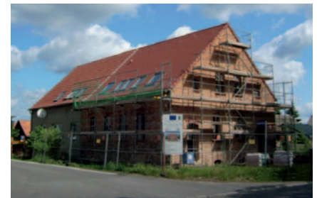
Hofladen, neu eingedeckt

Die den Originalbauteilen nachempfundenen Fenster und Türen werden ebenso wie die Innentreppe zum Obergeschoß Ende Juni montiert.